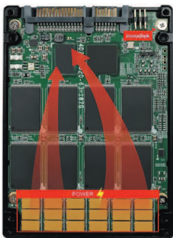
РИС. 1. ► Размещение дополнительных конденсаторов на плате накопителя

Как известно, твердотельный накопитель (solid-state drive, SSD) принимает данные от DRAM-буфера. Благодаря этому операции ввода-вывода становятся более быстрыми и эффективными. Решение компании Innodisk — iCell Technology — продвигает такую архитектуру еще на один шаг вперед за счет использования на плате накопителя нескольких дополнительных конденсаторов, задача которых заключается в том, чтобы обеспечить питание буфера в случае внезапного отключения электроэнергии (рис. 1). Сразу после того, как детекторы напряжения в цепи питания обнаруживают внезапное падение напряжения относительно штатных 5 В, данные конденсаторы мгновенно начинают отдавать накопленную в них мощность и тем самым некоторое время поддерживают шину питания.