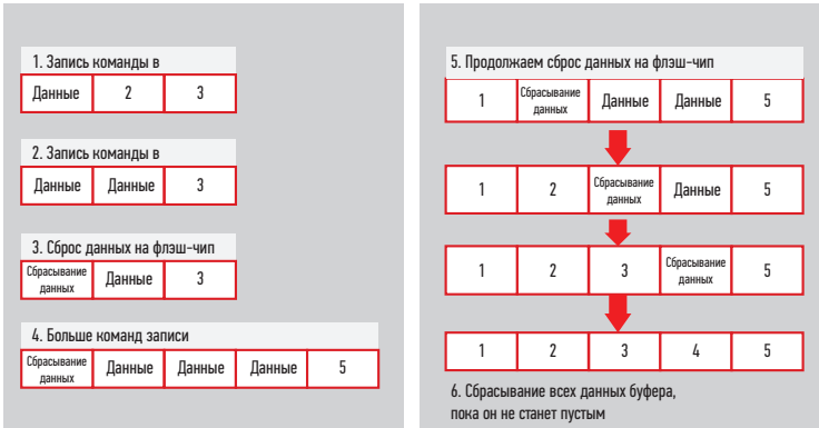
РИС. 4. ◀ Пример управления буфером данных