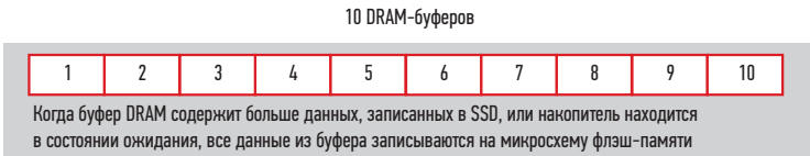
РИС. 3. ◀ Применение iCell Technology с накопителями 3MG2-P/3MR2-P/3SR3-P/3SE2-P

данных буфера во флэш-память. Сложное управление буфером данных iCell Technology гарантирует, что все данные буфера будут сброшены на флэш-чип еще до полной потери мощности питания. ●