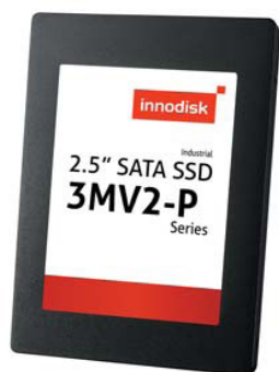
Рис. 1. SSD 3MV2-P 2,5"

Компании Innodisk интересны проекты в самых разных сферах, и она планирует продолжать разработку и внедрение решений, соответствующих в том числе специфическим требованиям.